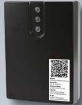
Module sans fil RWM200