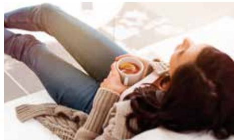
Solutions de chauffage résidentiel