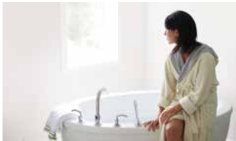
Solutions de chauffage d'eau

Dédiés à un type de confort plus intelligent, nos produits à valeur ajoutée restent en phase avec les exigences d'un monde en mutation.