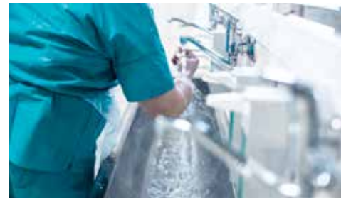
Solutions commerciales de chauffage d'eau