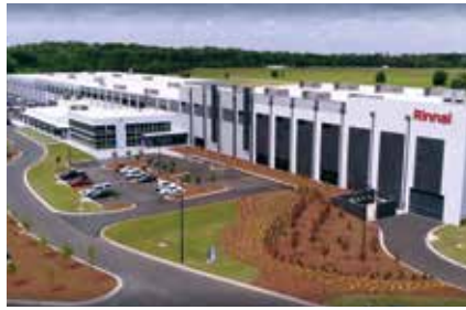
Rinnai America à Griffin, Géorgie, É.-U.